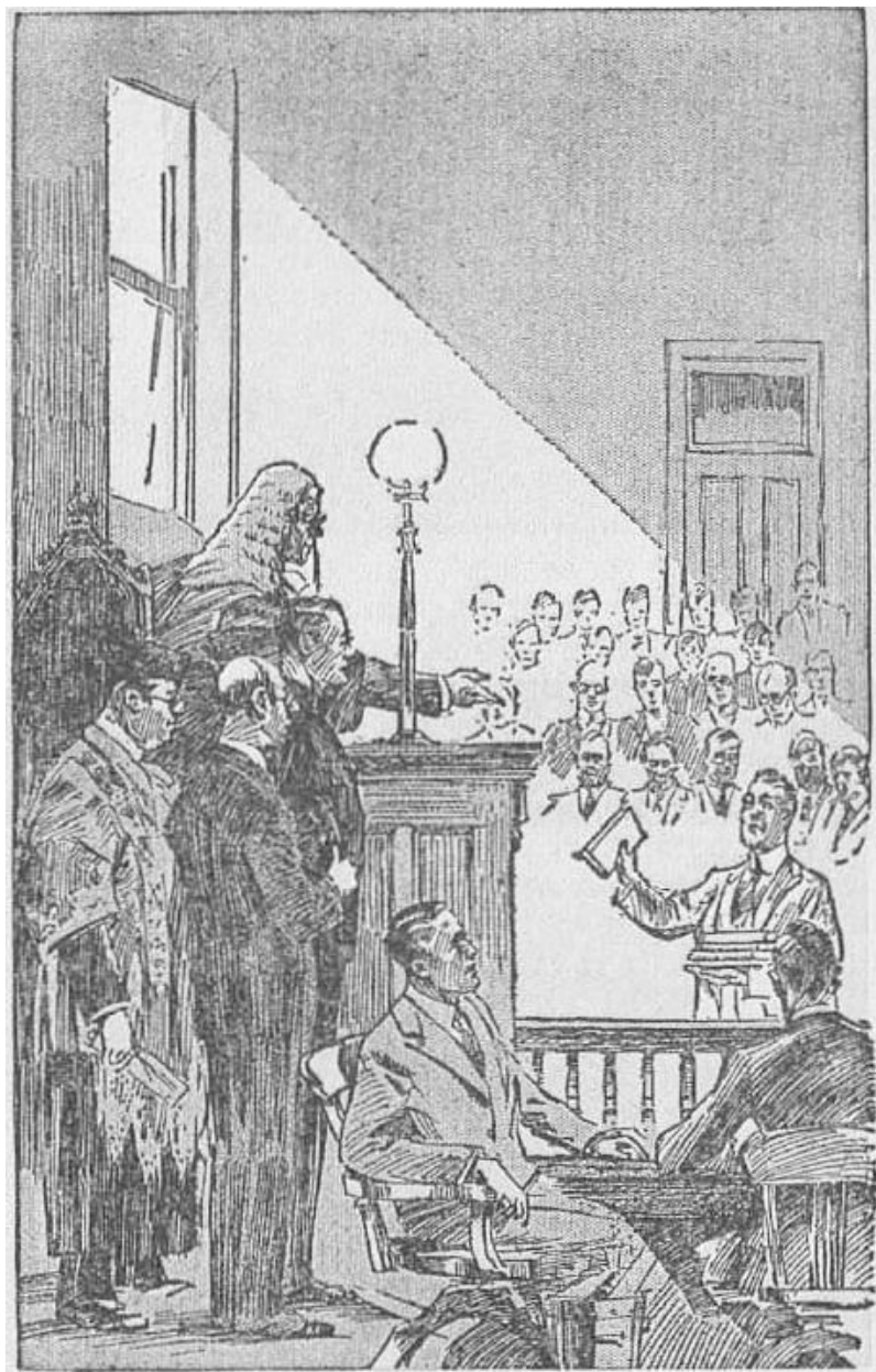
1933г. после Христа Свидетели Иеговы в такой же позиции.